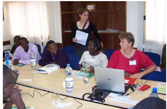
L'atelier sur la Convention Cadre de Lutte AntiTabac