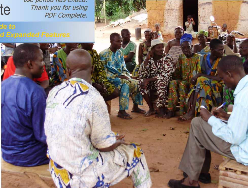
Rencontre avec la population de Sakété – Sahoro pour une analyse de la gestion d'eau