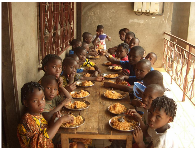
Repas commun à l'orphelinat Yédidja (avant le déménagement)

Considéré dans le jargon social comme le milieu fermé, ce volet s'occupe des OEV interné après une enquête psychosociale révélant un besoin d'accueil pressant dans le centre nommé Yédidja. En 2008 les enfants internés étaient au nombre de 25 dont 12 filles et 13 garçons, tous inscrits à l'école ou au collège. Une des filles a été réinsérée dans sa