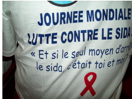
Séance de sensibilisation sur le SIDA à Novotel Cotonou : Arbre de vie a été invitée pour l'animation à travers un sketch