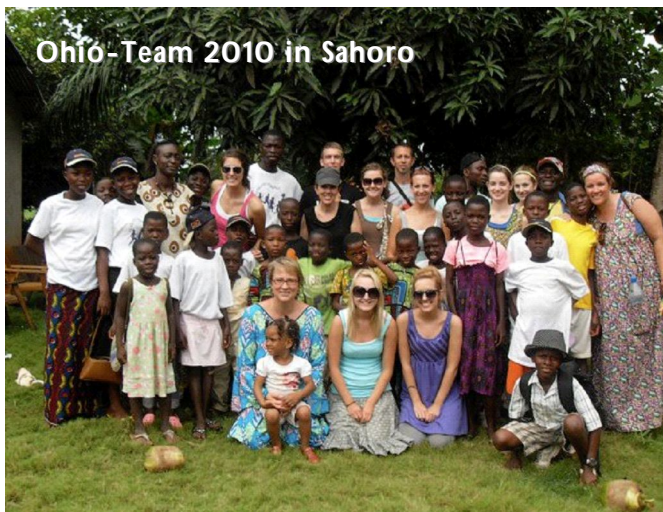
Ohio-Team 2010 in Sahoro

Wir hatten eine gute Zeit miteinander, es war gut zu erleben, wie sich jeder in die Kultur einlebte und mit mehr oder weniger Mühe an das Essen gewöhnte. Aktivitäten des Teams waren u.a. Arbeit im Garten (Unkraut jäten), Evangelisationsveranstaltungen und Besuche im Krankenhaus, in dem Dorf Sahoro und der Gottesdienstbesuch in Sakété.